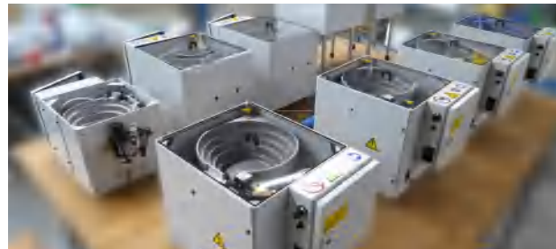
Flexibilní – prostřednictvím vlastní výroby