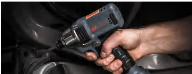
Přesné nářadí pro sofistikovanou výrobu

Protože pokud jde o průmyslové nářadí, měřicí nebo automatizační technologii, pak vám skutečně pomůžeme. Rychle, nekomplikovaně a cílevědomě. S námi nezískáte jakékoli nářadí, ale vždy to nejlepší řešení pro každý krok vašeho montážního procesu. S nejlepší přidanou hodnotou a s nejuhodněnějšími službami. Z toho můžete těžit.