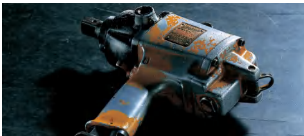
Robustní a odolné pro dlouhou životnost