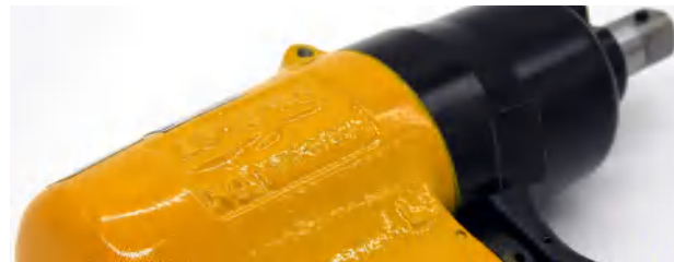
Vysoce jakostní nářadí pro každé nasazení