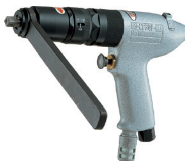
US-LT60PB-11(P) „P“ v modelovém označení = výstupní čtyřhran 3/8“.